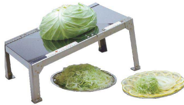
1 キャベリーナ KB-727 [EKSL-09] 国産

17-0339-0101 ¥18,800 サイズ:350×200×H180 重量:1.4kg 厚さ調節:0.3~3mm程 刃渡り:200mm ※安全の為使用の際は付属の安全手袋をご使用下さい。