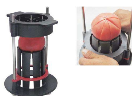
10 トマトウェッジャー TM8 [ECUT-26] 国産

17-0339-0901 ¥15,800 サイズ:165×224×H254 重量:800g 材質:本体/PC、ステンレス 刃/ステンレス トマト最大径:φ80 スライス厚:10 ●グリップを押し下げるだけでトマトの輪切りに均一にできます。 ●刃物は替刃式なので差し換え可能です。 ●本体の長辺が224mmとコンパクトで場所を取りません。