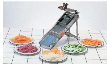
5 マトファ 18-0 マンドリンカッター [EMDC-01]

17-0339-0401 ¥24,900 サイズ:415×170×H170 重量:1.6kg 投入口:90×90(仕切板により可変式) 厚さ調節:スライス厚0.5~10mm 付属品:3.0mm千切り刃、3.0mm千切り刃用厚み固定プレート、押し板、仕切り板 ●独自のVカッターの採用で抜群の切れ味。 ●付属の千切り刃(約3mm角)を使用することで、スライス&千切りが思いのままです。 ※別売で2mm千切り刃・4mm千切り刃があります。 ※別売の2mm・4mm刃ご使用の際は、別途投入口も必要です。