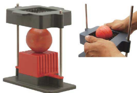
9 トマトスライサー トマトくん TMS80-10 [ESLC-60] 国産

17-0339-0801 ¥49,000 サイズ:410×195×H250 重量:3kg 投入口:φ100 厚さ調節:0.5~10mm(無段階)ダイヤル式メモリ付 ●円形の投入口とV字刃が、丸く切りにくい食材もやわらかい食材も、きれいに均一にできます。