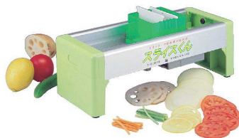
4 手動スライサー「スライスくん」 [ESLC-04] 国産

17-0339-0401 ¥24,900 サイズ:415×170×H170 重量:1.6kg 投入口:90×90(仕切板により可変式) 厚さ調節:スライス厚0.5~10mm 付属品:3.0mm千切り刃、3.0mm千切り刃用厚み固定プレート、押し板、仕切り板 ●独自のVカッターの採用で抜群の切れ味。 ●付属の千切り刃(約3mm角)を使用することで、スライス&千切りが思いのままです。 ※別売で2mm千切り刃・4mm千切り刃があります。 ※別売の2mm・4mm刃ご使用の際は、別途投入口も必要です。