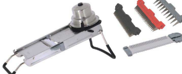
7 デバイヤー レボリューション スライサー 2012.01 [ESLC-64] 国産

17-0339-0601 ¥26,500 サイズ:445×197×H220 材質:本体/ABS樹脂 刃/ステンレス 付属品:クシ刃プレート3.8mm、スライスプレート、安全ホルダー、収納ケース ●クシ刃プレートとスライスプレートでスライス1・2・4・5mm ●コブレット(網目)切りも可能です。