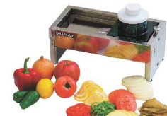
8 Vスライサー MV-50D [ESLC-05] 国産

17-0339-0701 ¥53,000 サイズ:500×185×180 材質:本体/ステンレス、ポリアミド、PP 刃/ステンレス、PP ●マルチカットはキューブ、ひし形、スライス、みじん切り、千切り、フッフルカット、クリンクルカットが可能です。 ●カットの厚みは極薄から10mm程度です。 ●業務使用に耐える強靱な千切り刃3種、両面使用可能なスライス用刃があります。 ●プッシャー付で安心してご使用いただけます。 ※刃は手洗い推奨