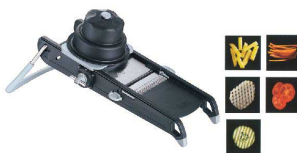
6 デバイヤー マンドリンカッター スイグプラス 2015-03 [ESLC-57] 国産

17-0339-0601 ¥26,500 サイズ:445×197×H220 材質:本体/ABS樹脂 刃/ステンレス 付属品:クシ刃プレート3.8mm、スライスプレート、安全ホルダー、収納ケース ●クシ刃プレートとスライスプレートでスライス1・2・4・5mm ●コブレット(網目)切りも可能です。