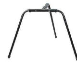
3 VC-4・VC-8用 専用スタンド