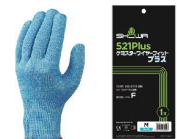
9 ショーワ ケミスターワイヤーフット プラス No521Plus [LTBK-18]

手のひらまわり S 約19cm 17-0344-0801 ¥2,080 M 約20cm 17-0344-0802 ¥2,080 L 約22cm 17-0344-0803 ¥2,080 XL 約22.5cm 17-0344-0804 ¥2,080 材質:アラミド、ポリエステル ●柔軟性を考慮した作りで作業性に優れています。 ●長繊維を採用し、手袋からのホコリや糸くずの発生を抑えます。 ●インナー手袋としても使用が可能です。