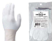
7 ショーワ ケミスターフィット No520 [LTBK-17]

全長 手のひらまわり S 22.0cm 約16.5cm 17-0344-0601 ¥1,480 M 22.5cm 約18.5cm 17-0344-0602 ¥1,480 L 23.0cm 約19.0cm 17-0344-0603 ¥1,480 材質:ポリエチレン、ポリエステル、グラスファイバー他 ●独自のデュラコイル繊維技術により、耐切創性と肌触りの良さ、高い作業性を実現。 ●繊維部分は編み目が細かく縫い合わせのないシームレス編みです。