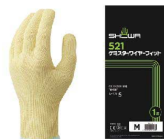
8 ショーワケミスター ワイヤーフット No521 [LTBK-06]

全長 手のひらまわり S 17.5cm 約17.0cm 17-0344-0701 ¥1,660 M 17.5cm 約19.0cm 17-0344-0702 ¥1,660 L 18.0cm 約19.5cm 17-0344-0703 ¥1,660 材質:ポリエチレン、ポリウレタン他 ●耐切創繊維を採用し切れにくい。 ●長繊維の採用により、手袋からのホコリや糸くずの発生を抑えます。