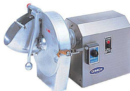
4 野菜調理機 OMV-300D

特殊減速機構の採用により、静粛で耐久性に優れ、衛生面にも配慮。 社員食堂や病院、給食センター、ホテル、レストランなどにおすすめ！