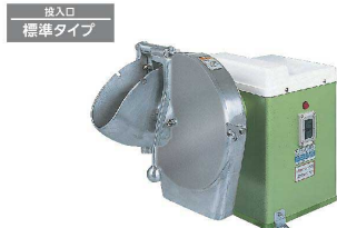
1 卓上野菜調理機 VC-4 [EYCK-11]

17-0344-0101 ¥369,000 サイズ:360×645×H465 重量:29kg 電源:単相100V 50/60Hz 消費電力:200W 回転数:335/400rpm プレート外径:φ306 処理能力:ジャガイモ 10mmで約360kg/時 付属品:輪切りプレート(0~13mm厚)、 卸プレート、短冊切プレート(3×4mm) ※三相用もあります。