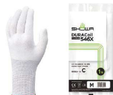
6 ショーワ 耐切創手袋 DURACOIL 546X [LTBK-18]

全長 手のひらまわり S 22.0cm 約16.5cm 17-0344-0601 ¥1,480 M 22.5cm 約18.5cm 17-0344-0602 ¥1,480 L 23.0cm 約19.0cm 17-0344-0603 ¥1,480 材質:ポリエチレン、ポリエステル、グラスファイバー他 ●独自のデュラコイル繊維技術により、耐切創性と肌触りの良さ、高い作業性を実現。 ●繊維部分は編み目が細かく縫い合わせのないシームレス編みです。