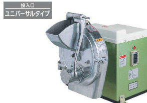
2 ユニバーサル卓上野菜調理機 VC-8 [EYCK-12]

17-0344-0101 ¥369,000 サイズ:360×645×H465 重量:29kg 電源:単相100V 50/60Hz 消費電力:200W 回転数:335/400rpm プレート外径:φ306 処理能力:ジャガイモ 10mmで約360kg/時 付属品:輪切りプレート(0~13mm厚)、 卸プレート、短冊切プレート(3×4mm) ※三相用もあります。