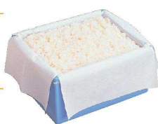
※コンテナは別売です

炊飯米から出た水蒸気を早く吸収し逆流を防ぎます。炊飯米のべたつき・ふやけを防ぎ、美味しさを長時間保ちます。炊飯米の剥離性が抜群です。袋に強度があります。ライスパックだけで移し替えができます。