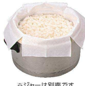
※ジャーは別売です