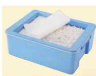
※コンテナは別売です