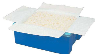
※コンテナは別売です