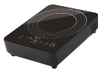
6 ドリテック IHクッカー ピコ DI-223BK [EIHK-72] 図

17-0383-0601 ¥13,000 サイズ:190×250×H60 重量:1.5kg 電源:単相100V 50/60Hz 消費電力:200~1,000W コードの長さ:1.8m 温度調節:5段階(60・80・160・180・200℃) 使用可能な鍋寸法:底径約φ120~180(揚鍋φ150~180)