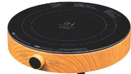
4 丸型IH調理器 SICH-W1400 [EIHK-76] 図

17-0383-0401 ¥15,000 サイズ:260×273×H58 重量:1.8kg 電源:単相100V 50/60Hz 消費電力:100~1,400W コードの長さ:1.9m 温度調節:6段階 使用可能な鍋寸法:底径φ80~240 ●ダイヤル式で操作が簡単です。 ●トッププレートに温度の確認がしやすい火加減の早見表示。 ●マグネットプラグ式 ●6段階(約150℃~200℃)の温度調節ができる「揚げ物」、「加熱・タイマー」モード搭載。