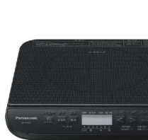
1 パナソニック IH調理器 KZ-PH34-K [EIHK-74] 図

17-0383-0101 ¥22,000 サイズ:304×345×H54 重量:2.5kg 電源:単相100V 50/60Hz 消費電力:75~1,400W コードの長さ:1.9m 温度調節:7段階 使用可能な鍋寸法:底径φ120~260 ●プレーカーが落ちにくい「1,000Wセーブ」 ●鋳物ホーロー鍋、ステンレス鍋に対応した「炊飯コース」搭載。 ●食材をじっくりやわらかく仕上げる「煮込みコース」搭載。 ●温度(140℃~200℃)を自動コントロールできる「揚げ物コース」搭載。