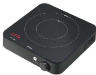
5 ドリテック IHクッカー ミニチュラ DI-218BK [EIHK-73] 図

17-0383-0501 ¥11,500 サイズ:185×195×H55 重量:1.3kg 電源:単相100V 50/60Hz 消費電力:100~800W コードの長さ:1.8m 温度調節:8段階 使用可能な鍋寸法:底径φ100~140(鉄瓶φ80) ●500mlペットボトルより小さく、コンパクトな作りです。 ●フラット形状で汚れもサッと拭き取れます。