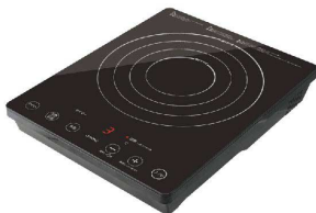
8 ドリテック IHクッカー ラルゼ DI-120BK [EIHK-74] 図

17-0383-0801 ¥15,600 サイズ:290×365×60 重量:2.7kg 電源:単相100V 50/60Hz 消費電力:100~1,400W コードの長さ:1.8m 温度調節:9段階(120・130・140・150・160・170・180・190・200℃) 保温調節:30~90℃(5℃刻み) 使用可能な鍋寸法:底径φ100~240(揚鍋φ180~220)