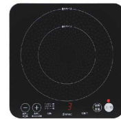
7 ドリテック IHクッカー ピッコリーノ DI-217BK [EIHK-75] 図

17-0383-0701 ¥11,500 サイズ:205×205×H58 重量:1.5kg 電源:単相100V 50/60Hz 消費電力:100~1,000W コードの長さ:1.8m 温度調節:9段階(60・65・70・75・80・85・90・95・100℃) 保温モード:60~80℃ 5℃刻み(30分間可能) 使用可能な鍋寸法:底径φ100~160 ●加熱モード(10段階)、定温モード(9段階)搭載。