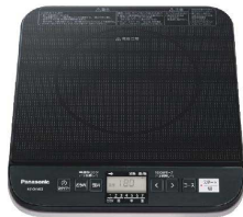
2 パナソニック 業務用IH調理器 KZ-CK1402 [EIHK-78] 図

17-0383-0101 ¥22,000 サイズ:304×345×H54 重量:2.5kg 電源:単相100V 50/60Hz 消費電力:75~1,400W コードの長さ:1.9m 温度調節:7段階 使用可能な鍋寸法:底径φ120~260 ●プレーカーが落ちにくい「1,000Wセーブ」 ●鋳物ホーロー鍋、ステンレス鍋に対応した「炊飯コース」搭載。 ●食材をじっくりやわらかく仕上げる「煮込みコース」搭載。 ●温度(140℃~200℃)を自動コントロールできる「揚げ物コース」搭載。