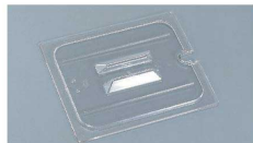
⑥ フードパン ドレンシェルフ(水切り皿)