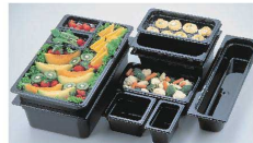
② フードパン 平面カバー クリア：中身がみえる ブラック：光を通さず肉やチーズの変色を防ぐ