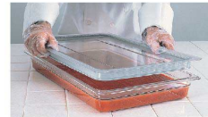
④ フードパン 取手付カバー