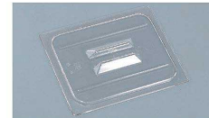
⑤ フードパン 切込・取手付カバー