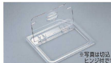
⑧ フードパン ヒンジ付カバー