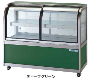
ディープグリーン