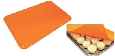
蒸し物のフタや煮物の落としぶたに。