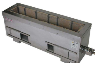
⑤ 耐火レンガ木炭コンロ (火起しバーナー付) [EMKO-08]