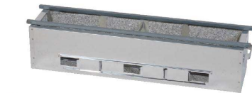
② 耐火レンガ 木炭コンロ [EMKO-05]

付属品：鉄久16mm角×2本 ●内側耐火レンガ貼り ●耐火レンガは耐火性・耐久性に優れています。 ●別注製作可能