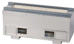
① 耐火レンガ 木炭コンロ [EMKO-04]