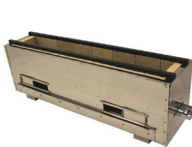
④ 耐火レンガ木炭コンロ (火起しバーナー付) [EMKO-06]