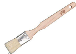
④ 白豚 金巻 テリハケ

●馬毛の最もやわらかい毛を使用していますので、デリケートな食材に塗る時に最適です。