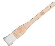
⑥ ナイロン テリハケ