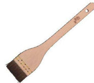
③ 銅毛 テリハケ(馬毛銅毛)