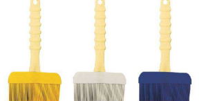
⑫ シリコン塗り刷毛 LL