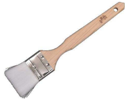
⑤ ナイロン 金巻 テリハケ