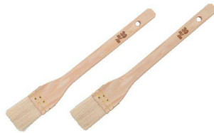
② 羊毛 テリハケ(山羊毛)