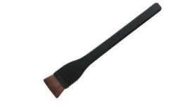
⑧ 黒塗り柄はけ(馬毛)