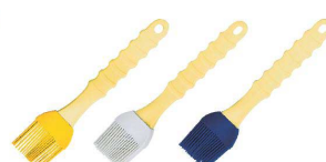
⑪ シリコン塗り刷毛 L