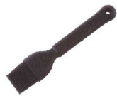
⑬ マトファ シリコンクッキングブラシ