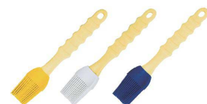
⑩ シリコン塗り刷毛 M