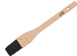
① 天馬 テリハケ(馬毛天馬)