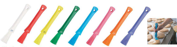
⑭ ヴァイカン USTペストリーブラシ 555130 [DHKE-16] △ 洗