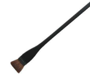
⑦ 黒塗り柄はけ 細柄(馬毛)

●使いやすいナイロンの毛を使用しているため、コシが強く粘度の高い食材に塗る時に最適です。