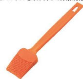
⑮ シリコンクック刷毛 No2256