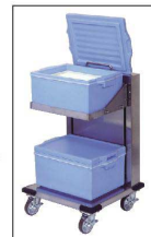
※コンテナは別売です。