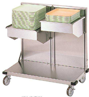
KN 4245 W