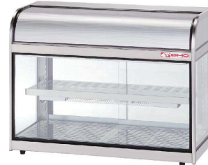
② ホットショーケース RHLTb-900 [FHTS-53]

右(R) 17-0482-0101 ¥440,000 左(L) 17-0482-0102 ¥440,000 サイズ:1200×350×H515 電源:単相100V 50/60Hz 消費電力:約330W 重量:36kg 有効容積:97ℓ 庫内温度:50~70°C(温度調節器付) ●チューブヒーター方式 ●庫内照明付(キセノンポーランプ) ●フレームはSUS304ヘアアライン仕上げ。