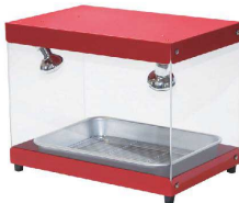
③ フードショーケース FS-100

カフェ、コンビニエンスストア等で重宝されるショーケースのラインナップ。 商品をクリアに魅せられるので、購買意欲のアップにつながります。