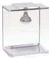
⑤ 保温ケース ホットケース [FHTS-36]

お惣菜や揚げ物を販売する保温器になっています。 前面と側面が透明なアクリル製なので外から見やすい形状です。