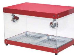
④ フードショーケース FS-200

[FHTS-26] 17-0482-0301 ¥50,000 庫内温度:30~35°C(室温20°Cの場合) ●製品を明るく照らすレフランプ仕様 ●背面がオープンなので製品の出し入れが簡便です。 ※揚げ物類の長時間保温には適しません。