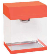
⑥ 保温ケース オレンジケース [FHTS-37]

17-0482-0501 ¥32,000 サイズ:430×320×H520 電源:単相100V 消費電力:250W 背面オープン 庫内温度:40~50°C(室温20°Cの場合) 付属品:ケーキパット16インチ×1