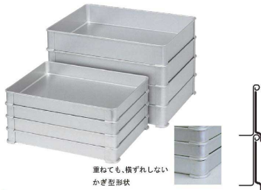
重ねても、横ずれしない かぎ型形状