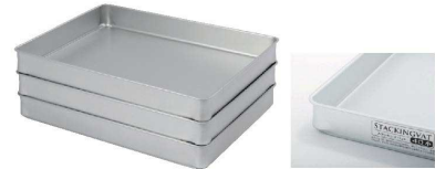
足金具が無く、洗いやすく、衛生的です。