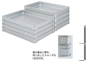
積み重ねに便利、取り出しもスムーズなL足付き。