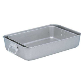
① アルミ 米飯かん [ABHB-01] △ 目