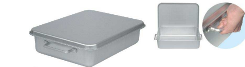
⑧ アルミ 天ぷらパット(蓋付) [ATPR-02] △ 目