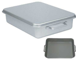
② アルミ ごはんパット(蓋付) [ABHB-03] △ 目