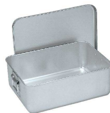
⑤ アルマイト 給食用パン箱(蓋付) [APNB-03] 目