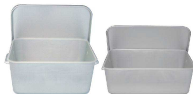
④ アルミ 重ねるパン箱(蓋付) [APNB-01] 目