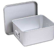
③ アルマイト 給食用飯缶(蓋付) [ABKN-08] 目