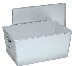
⑥ アルマイト 給食用パン箱 深型(蓋付) [APNB-04] 目