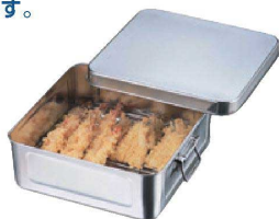
⑩ 18-8 天ぷらパット [ATPR-01]