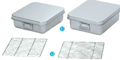
⑪ アルマイト 天ぷら入(蓋付) [ATPR-05] 目