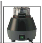
主電源スイッチ付き