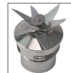
6枚刃が切削性能を高 める。高い切削性能