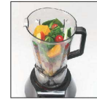
ほうれん草ピーナッツ と和え+ゲル化剤

17-0544-0201 ¥150,000 サイズ:230×270×H515 重量:6kg 容器容量:2.0ℓ 処理容量:0.3~1.5ℓ 電源:100V 50/60Hz 消費電力:770W 回転数:3,000~24,000回/分 定格時間:15分(4分運転・2分休止) 電源コード:2.15m ●80℃までの温かい食材にも対応。 ●丈夫なステンレス製ボトル。耐久性や耐熱性にもすぐれ、食材におい移りも防ぎます。