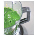
なめらかな仕上が