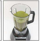
グリーンスムージー