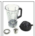
分解・清掃で衛生的