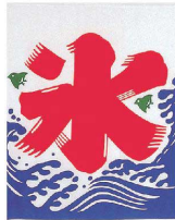
① 氷旗 [VHTA-01] △