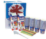
⑲ かき氷100人セット(1.8ℓ×2本) [GKBS-02] ㊄