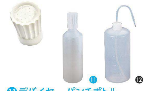
⑪ デバイヤー パンチボトル

サイズ:φ80×H270 容量:1.0ℓ ●容器にシャワーがついていて、楽にカップに蜜をかけることができます。