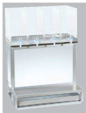
⑦ シロップケース 4ケース用

アクリルケースが個々にセパレートになり取り外し可能です。 注ぎ口は高さがある為、山盛りかき氷に対応可能。