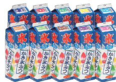
⑰ 氷蜜(ストレート蜜) 1.8ℓ [GKMT-01] ㊄

賞味期限:製造日より30ヶ月 ●合成着色料、甘味料、保存料入り。 ●バラエティに富んだ品ぞろえが特徴の氷みつです。 ※返品不可商品になります。 ※軽減税率対象品