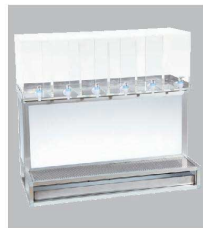
⑧ シロップケース 6ケース用