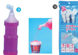
⑨ ハンディーシャワーセット [GMKY-01] ㊄