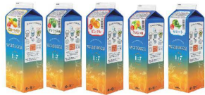
⑮ ノンアルコールベースシロップ warocca 1.0ℓ (12本入) [GKMT-06] ㊄