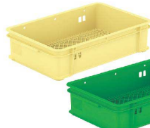
⑨ サンコー PP大型番重 A-6 [ABJC-38] U