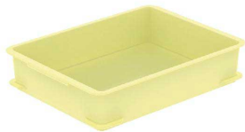
⑭ サンコー PP番重 K型 [ABJC-43] △ U