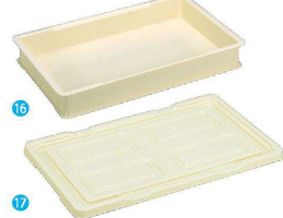
⑯ トンポ PPフードコンテナ [ABJC-05] △ B