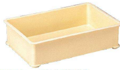
③ サンコー PP大型番重 [ABJC-09] △ U