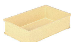
⑥ サンコー PP番重 G型 [ABJC-11] U