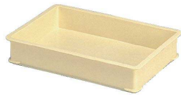
① サンコー PP番重 [ABJC-10] U