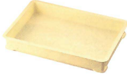
② サンコー PP中型番重 [ABJC-12] U