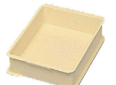
⑦ サンコー PP半番重 [ABJC-13] U