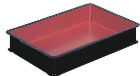
⑩ サンコー ABS朱塗番重 [ABJC-15] U