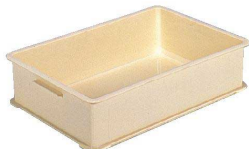
⑤ サンコー PP超特大番重 A型 [ABJC-07] U