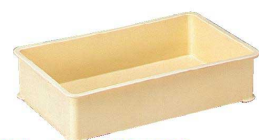
④ サンコー PP特大番重 [ABJC-08] △ U