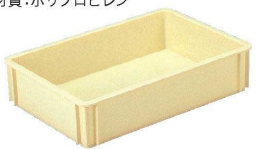
⑧ サンコー 油脂箱 [AKTA-22] U