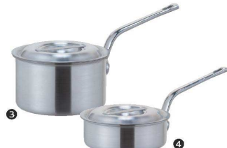
③ KYS アルミ片手鍋(目盛付) [AKFB-04]