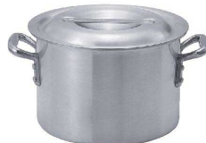
② KYS アルミ半寸胴鍋(目盛付) [AHZB-03]