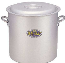
⑤ アルミ マスター 寸胴鍋 [AZUB-04] V