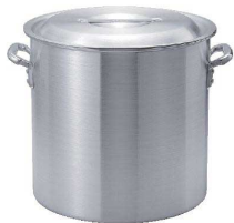
① KYS アルミ寸胴鍋(目盛付) [AZUB-03]