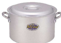
⑥ アルミ マスター 半寸胴鍋 [AHZB-04] V