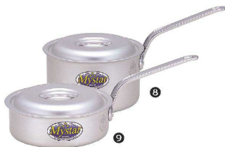
⑧ アルミ マスター 片手鍋 [AKFB-03] V