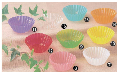
材質: OPP フィルム