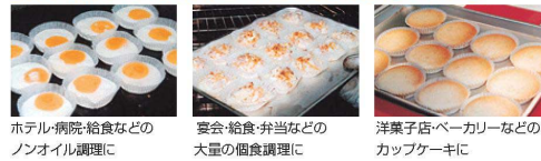
ホテル・病院・給食などの ノンオイル調理に 宴会・給食・弁当などの 大量の個食調理に 洋菓子店・ベーカリーなどの カップケーキに