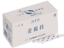
② 袋入 麦楊枝 (和文字) (1,000本入)