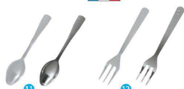
⑪ ミニスプーン (250本入) [NSLA-2B] ◇

CS50700 クリア 17-0838-1101 ¥3,500 CS50724 シルバー 17-0838-1102 ¥6,750 サイズ:97×20 ポリスチレン(シルバーのみメタルコーティング)