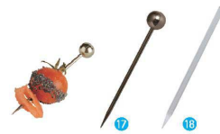
⑰ ピック シルバー (200本入) VO10204 [NSLA-31] △

17-0838-1701 ¥7,000 サイズ:φ10×70 ポリスチレン(メタルコーティング)