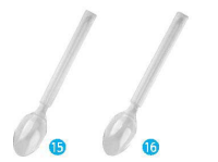
⑮ エクセレンス デザートスプーン クリア (100本入) [NSLA-43] △