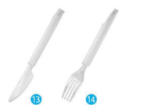
⑬ エクセレンス デザートナイフ クリア (100本入) [NSLA-41] △

CS50703 クリア 17-0838-1201 ¥3,500 CS50725 シルバー 17-0838-1202 ¥6,750 サイズ:97×16 ポリスチレン(シルバーのみメタルコーティング)