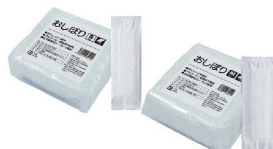
⑳ 不織布おしぼり テフキーO3 (100枚入) [KHKN-35] ◇

おしぼりサイズ S(48袋入) 120×215 17-0838-2001 ¥25,800 M(40袋入) 145×235 17-0838-2002 ¥25,800 L(36袋入) 180×235 17-0838-2003 ¥25,800 材質:不織布(レーヨン40%、PET 60%) 成分:軟水 オゾン水(除菌・消臭)