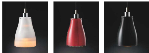
ILF-18 (F) フロスト

ランプから放射される赤外線が料理を中心までしっかりと保温。 ランプの下に置くだけで出来立ての料理の美味しさ、温かさをしっかり保ちます。