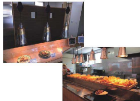
ILA-18 (K) ブラック