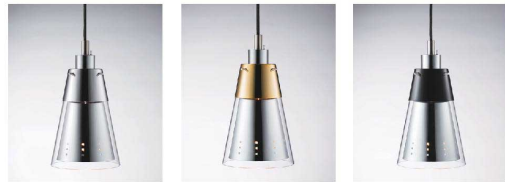
ILA-18 (S) シルバー