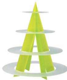
④ スタンド Cod.304 [NSVS-04] 組 17-0876-0401 ¥103,000 サイズ:φ560×H620 プレート:1段目/φ560 幅100 2段目/φ460 幅100 3段目/φ330 幅90 4段目/φ220