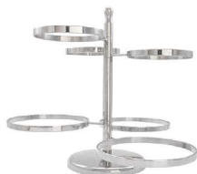
⑨ SW18-8 くるっと2段回転スタンド [NTST-06] 17-0876-0901 ¥38,000 サイズ:400×400×H313 リング径:上段/φ126 下段/φ168 ● 上段と下段は取り外し可能なため、下段のみで使用することも可能です。