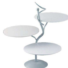
⑦ スタンド Cod.402.01 (ラウンドプレート付) ホワイト [NSVS-09] 組 17-0876-0701 ¥62,000 サイズ:500×450×H570 プレート:φ260×H15