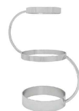
⑪ SW18-8 S型 3段ピュアアフタヌーンティースタンド [NTST-08] 17-0876-1101 ¥18,000 全長:360mm リング径:上段/φ126 中段/φ168 下段/φ168