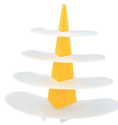
② スタンド Cod.301 [NSVS-02] 組 17-0876-0201 ¥101,000 サイズ:700×360×H620 プレート:1段目/700×350 2段目/630×300 3段目/520×250 4段目/420×200