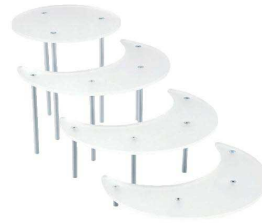
⑤ スタンド Cod.305 [NSVS-06] 組 17-0876-0501 ¥89,000 1段目/380×300×H160 2段目/380×300×H140 3段目/380×300×H1220 4段目/φ280×H300 脚材質:スチール ● 離散式で、各段が独立しているので自由に組み合わせができます。