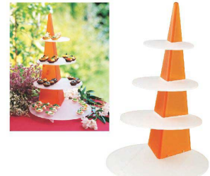
③ スタンド Cod.302 [NSVS-03] 組 17-0876-0301 ¥76,000 サイズ:φ390×H620 プレート:1段目/φ390 2段目/φ310 3段目/φ250 4段目/φ190