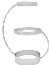
⑩ SW18-8 3段ピュアアフタヌーンティースタンド [NTST-07] 17-0876-1001 ¥19,000 全長:360mm リング径:上段/φ126 中段/φ168 下段/φ168