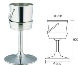
⑨ SW 18-8 B型酒捨器セット [NSSK-01] 17-0890-0901 ¥42,900 サイズ:φ300×H500 容量:6ℓ ●テーブルの下におしゃれな気配り。