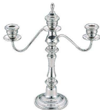
⑪ UK V型キャンドルスタンド 3本立 [NCDS-02] 17-0890-1101 ¥41,000 サイズ:355×H380 ローソク径:22