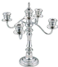
⑩ UK V型キャンドルスタンド 5本立 [NCDS-01] 17-0890-1001 ¥51,500 サイズ:355×H380 ローソク径:22