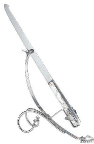
⑦ UK 18-8 ウェディングケーキ ナイフ スタンド [NWCK-05] 17-0890-0701 ¥46,000 サイズ:320×120×H330 ※写真のケーキナイフは別売です。