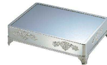
⑥ SW 18-8 角型ウェディングケーキスタンド [NMRP-05] サイズ 20インチ 534×403×H123 17-0890-0601 ¥101,000 22インチ 571×404×H123 17-0890-0602 ¥112,000 24インチ 631×411×H123 17-0890-0603 ¥123,000 ●アクリルミラー仕様です。