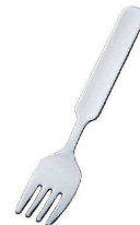
⑧ 18-8 1人で出来るもん フォーク [OCTC-04] ⑧ 17-0920-0801 ¥300 全長:140