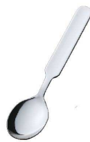
⑦ 18-8 1人で出来るもん スプーン [OCTC-03] ⑦ 17-0920-0701 ¥300 全長:140