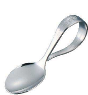
⑤ 18-8 ベビースプーン [OCTC-01] ⑤ 17-0920-0501 ¥1,100 全長:92