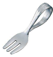
⑥ 18-8 ベビーフォーク [OCTC-02] ⑥ 17-0920-0601 ¥1,100 全長:92