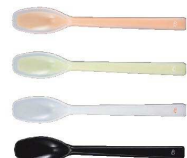
⑧ プリグレースプーン 一体ヘラ深型 [OKSS-08]