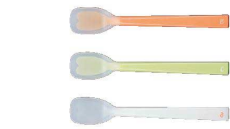
① プリグレースプーン ヘラ型 [OKSS-01]