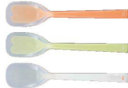
② プリグレースプーン ヘラ型大 [OKSS-02]