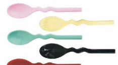
⑮ 口あたりのやさしいスプーン ウェビー 深型 [O0SS-09] 図