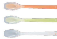
③ プリグレースプーン 深型 [OKSS-03]