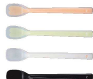
⑥ プリグレースプーン 一体ヘラ型 [OKSS-06]