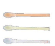
⑤ プリグレースプーン ピュア [OKSS-05]