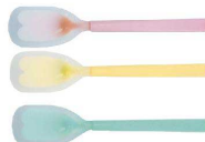
⑨ 口あたりのやさしいスプーン 大(ラージ) [O0SS-07] 図

シリコンゴムの中にコシのあるナイロン樹脂の芯を埋め込んだ新しいスプーンです。 小さなお子様にも安心してご使用いただけます。 煮沸消毒もできるので衛生的です。