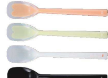
⑦ プリグレースプーン 一体ヘラ型大 [OKSS-07]