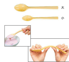
⑬ フレックス シリコンスプーン [O0SS-05] 図