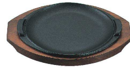
③ アサヒ ステーキ皿 新型丸 [PSTD-20]

鉄板 木台 kg 17cm φ170×H17 225×180 1.2 17-0943-0201 ¥5,000 19cm φ190×H17 250×200 1.4 17-0943-0202 ¥6,900