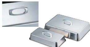
⑤ 18-8 角型ステーキカバー