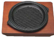
② ⑥ 鉄 ステーキ皿 グリル丸 [PSTB-51]

17-0943-0101 ¥5,800 鉄板:190×190×H30 木台:250×200 重量:2.3kg