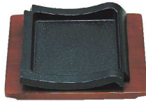
① ⑤ 鉄 ステーキ皿 瓦型 [PSTB-50]

17-0943-0101 ¥5,800 鉄板:190×190×H30 木台:250×200 重量:2.3kg