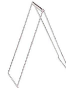
⑨ トキワ オイル焼用 ハンドル 705 [PSTC-22]

全長:70 材質:ポリスチレン ●同じテーブルで違う焼き加減のオーダーが入った場合でも安心して提供できます。