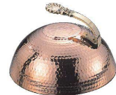
⑦ 銅製 ステーキカバー 丸型

17-0943-0601 ¥6,400 サイズ:φ273×H105×H190 (全高)