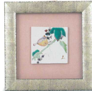
AP7-1103 陶額 山雀 22,000円 (税抜価格 20,000円) 縦22×横22cm・化粧箱入 磁器 ◆