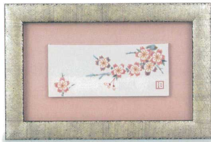
AP7-1106 陶額 桜 24,200円 (税抜価格 22,000円) 縦21×横31.5cm・化粧箱入 磁器 ◆