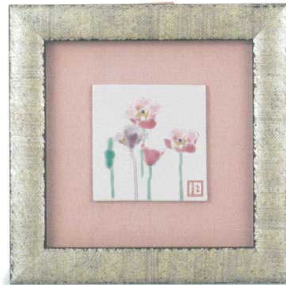
AP7-1102 陶額 ポピー 19,800円 (税抜価格 18,000円) 縦22×横22cm・化粧箱入 磁器 ◆