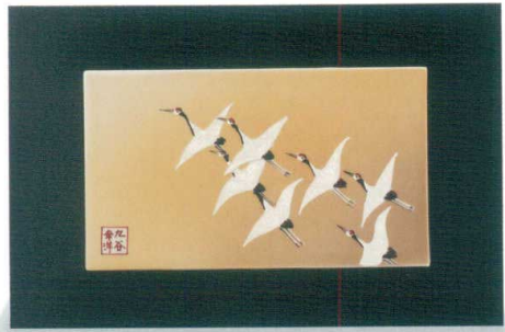
AP7-1101 陶額 飛翔 幸洋薫 15,400円 (税抜価格 14,000円) 縦19.5×横29.8cm・化粧箱入 磁器 ◆