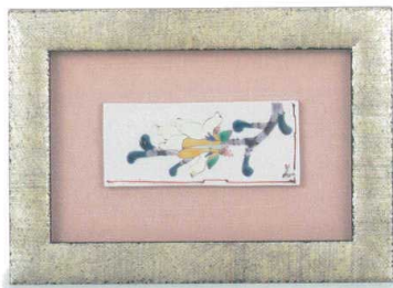
AP7-1104 陶額 こぶし 22,000円 (税抜価格 20,000円) 縦19×横16.5cm・化粧箱入 磁器 ◆