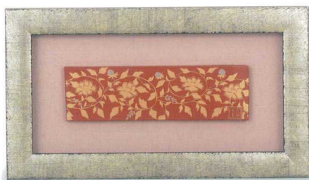
AP7-1107 陶額 金欄手 24,200円 (税抜価格 22,000円) 縦19×横33.5cm・化粧箱入 磁器 ◆