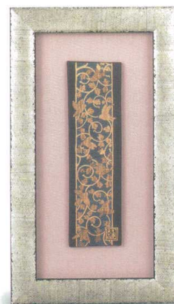
AP7-1108 陶額 青粒鳥唐草 26,400円 (税抜価格 24,000円) 縦33.5×横19cm・化粧箱入 磁器 ◆