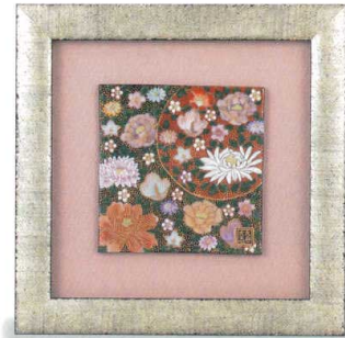
AP7-1112 陶額 花詰 33,000円 (税抜価格 30,000円) 縦26.5×横26.5cm・紙箱入 磁器 ◆