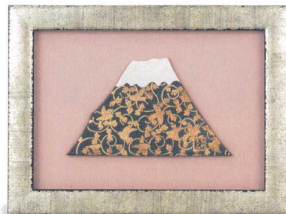
AP7-1116 陶額 青粒富士山 38,500円 (税抜価格 35,000円) 縦35.4×横24cm・化粧箱入 磁器 ◆