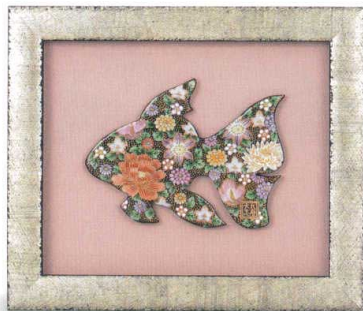
AP7-1115 陶額 花詰金魚 38,500円 (税抜価格 35,000円) 縦29×横25cm・紙箱入 磁器 ◆