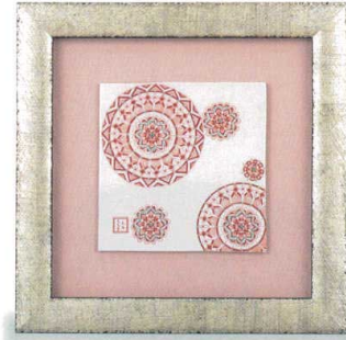
AP7-1110 陶額 赤絵丸紋 26,400円 (税抜価格 24,000円) 縦26.5×横26.5cm・化粧箱入 磁器 ◆