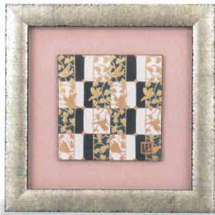
AP7-1113 陶額 青粒 33,000円 (税抜価格 30,000円) 縦26.5×横26.5cm・紙箱入 磁器 ◆