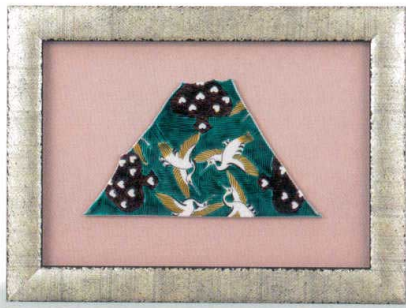
AP7-1111 陶額 富士山 29,700円 (税抜価格 27,000円) 縦24×横32cm・紙箱入 磁器 ◆