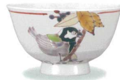
AP7-5019 紫式部に四十雀 大志窯 8,800円 (税抜価格 8,000円)