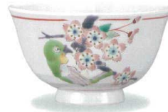
AP7-5022 桜に目白 大志窯 8,800円 (税抜価格 8,000円)