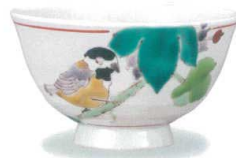
AP7-5018 野葡萄に山雀 大志窯 8,800円 (税抜価格 8,000円)