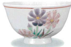
AP7-5025 秋桜 大志窯 7,700円 (税抜価格 7,000円)