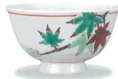
AP7-5026 紅葉 大志窯 7,700円 (税抜価格 7,000円)