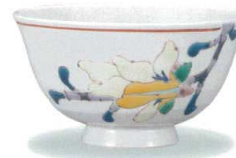
AP7-5027 辛夷 大志窯 7,700円 (税抜価格 7,000円)