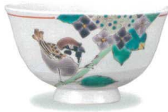
AP7-5021 額紫陽花に雀 大志窯 8,800円 (税抜価格 8,000円)