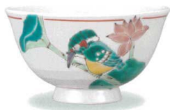
AP7-5020 蓮に翡翠 大志窯 8,800円 (税抜価格 8,000円)