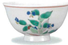
AP7-5023 露草 大志窯 7,700円 (税抜価格 7,000円)