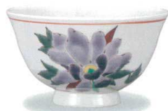
AP7-5024 牡丹 大志窯 7,700円 (税抜価格 7,000円)