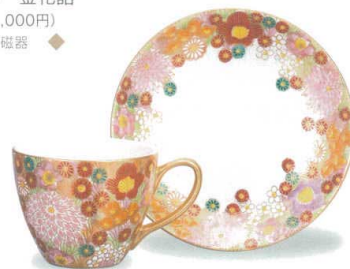
AP7-0901 カップ&ソーサー 金花詰 19,800円 (税抜価格 18,000円) 口径8.5×高さ6.7cm・容量250cc・化粧箱入 磁器 ◆