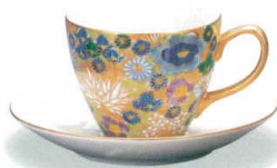
AP7-0909 ペアカップ&ソーサー 金花詰 19,800円 (税抜価格 18,000円) 口径8.5×高さ7cm・容量250cc・化粧箱入 磁器 ◆