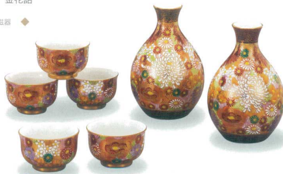
AP7-0707 酒器揃 金花詰 27,500円 (税抜価格 25,000円) 徳利 (径7.8×高さ12cm・容量240cc) 盃 (口径6×高さ3.8cm)・化粧箱入 磁器 ◆