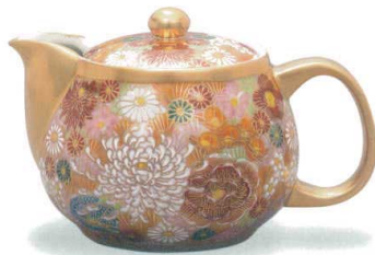
AP7-0454 ポット急須 金花詰 11,000円 (税抜価格 10,000円) 容量400cc・茶こし付・紙箱入 磁器 ◆

輪郭を煌びやかな金で彩色した様々な花の模様を散りばめた華やかな技法のひとつです。