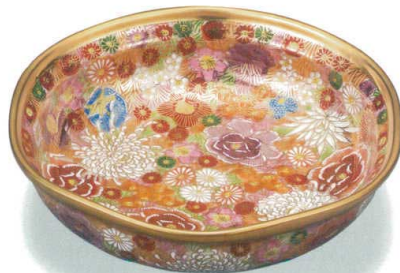
AP7-0337 6号鉢 金花詰 24,200円 (税抜価格 22,000円) 径19×高さ5.2cm・化粧箱入 磁器 ◆