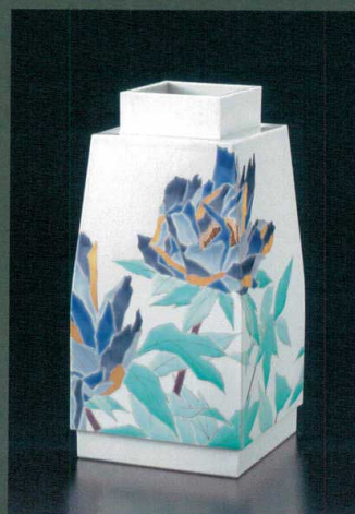
AP7-7004 方壺 色絵牡丹[静澄] 山岸大成 3,520,000円 (税抜価格 3,200,000円) 前幅21.5×奥行21.5×高さ43.5cm・桐箱入紐通し 磁器 ◆