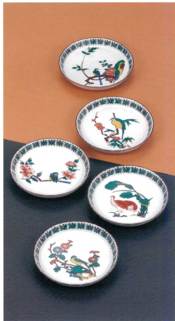
AP7-0125 4.5号皿揃 小紋花鳥 11,000円 (税抜価格 10,000円) 径13.5cm・化粧箱入 磁器 ◆