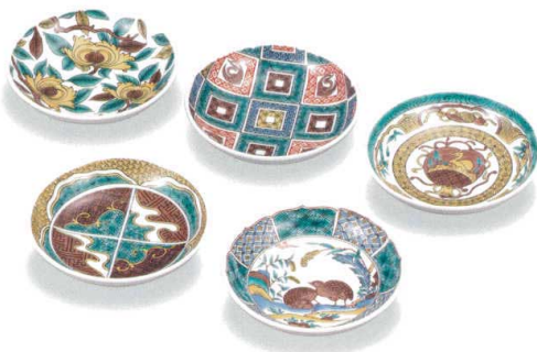
AP7-0124 4.2号皿揃 古九谷風 11,000円 (税抜価格 10,000円) 径12.6cm・化粧箱入 磁器 ◆