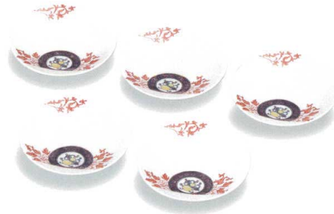
AP7-0122 4号皿揃 赤唐草宝文 銀泉窯 11,000円 (税抜価格 10,000円) 径12cm・化粧箱入 磁器 ◆