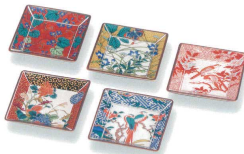
AP7-0128 4号皿揃 歴代画 13,200円 (税抜価格 12,000円) 前幅9×奥行9cm・木箱入 磁器 ◆