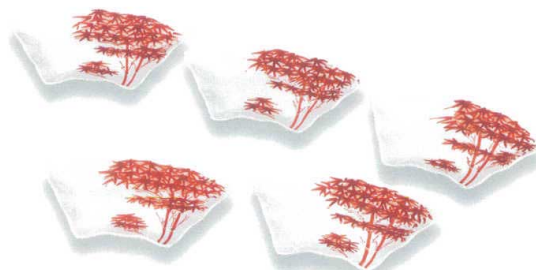
AP7-0130 4.5号皿揃 朱竹 幸洋窯 13,200円 (税抜価格 12,000円) 前幅14×奥行8.5cm・化粧箱入 磁器 ◆