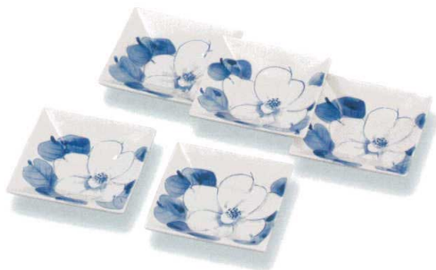
AP7-0127 3.5号皿揃 白椿 紅椿窯 12,100円 (税抜価格 11,000円) 辺10.2cm・化粧箱入 磁器 ◆