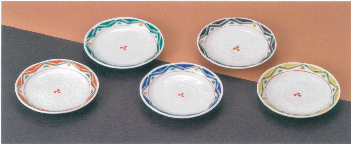
AP7-0126 5号皿揃 幾何文色絵変わり 前田敦子 12,100円 (税抜価格 11,000円) 径16.5cm・化粧箱入 磁器 ◆