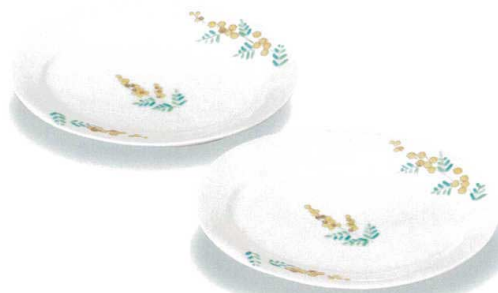
AP7-0243 ペア7号皿 ミモザ 幸洋薫 13,200円 (税抜価格 12,000円) 共に (前幅21.5×奥行17×高さ2.5cm)・化粧箱入 磁器 ◆