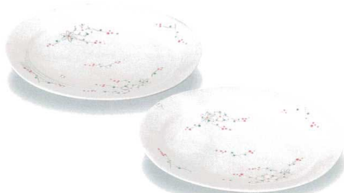
AP7-0242 ペア7号皿 花文 幸洋薫 13,200円 (税抜価格 12,000円) 共に (前幅21.5×奥行17×高さ2.5cm)・化粧箱入 磁器 ◆