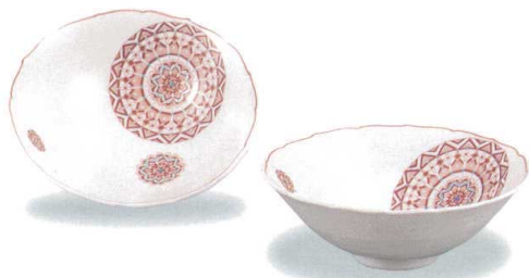
AP7-0240 ペア5.5号鉢 赤絵小紋 12,100円 (税抜価格 11,000円) 共に (径16.5×高さ6cm)・化粧箱入 磁器 ◆