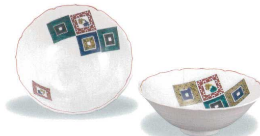
AP7-0241 ペア5.5号鉢 石畳の図 12,100円 (税抜価格 11,000円) 共に (径16.5×高さ6cm)・化粧箱入 磁器 ◆ ※他のバリエーションはP34・35にあります