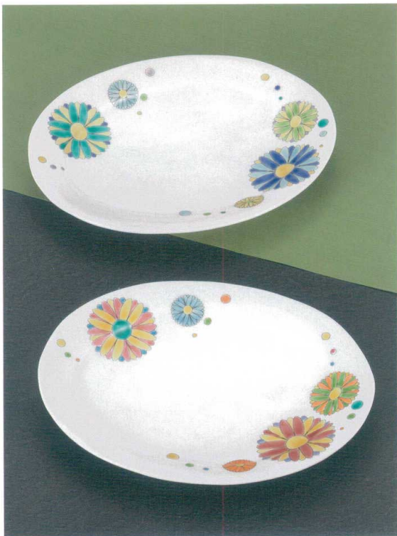
AP7-0237 ペア7号皿 華紋 11,000円 (税抜価格 10,000円) 共に (前幅21.5×奥行17×高さ2.5cm)・化粧箱入 磁器 ◆