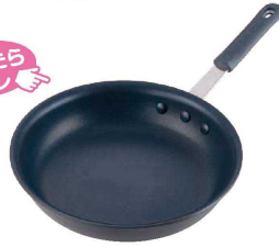
① TKG 硬質アルマイトフライパン (AFL-08)