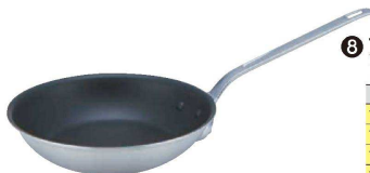
⑧ アルミプロマイスター CT フライパン (AHL-I6) ■