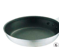
⑥ ⑦ テフロン セレクトフライパン (AHL-P5)