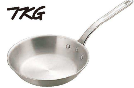
③ TKG キャスト フライパン (AHL-W6)