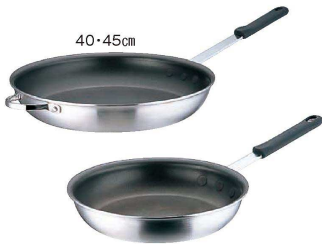
④ フライパン セレクト アルミ TKG (AHL-M3)