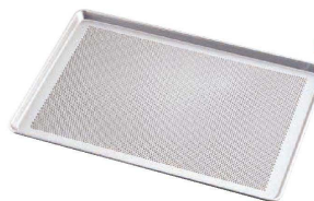
⑬ アルミパンチング天板 SN1073

1-1042-1201 6枚取 490×340×H45 ¥8,000 1-1042-1202 8枚取 380×290×H45 ¥7,400 板厚:1.2