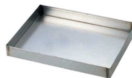
⑫ 鉄 シベリア天板 (WTV-03)

アルタイト = スチール (鉄) にアルミメッキ加工 (アルミメッキ銅板) 熱伝導が良く、焼きムラが無くきれいに焼きあがる。耐久性に優れている。