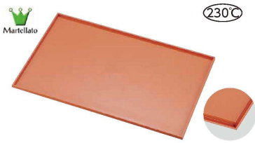
1 マルテラート シリコンノンスティック ベーキングシート 角測付 (WSL-77)