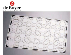
6 マトファ エグゾパン シリコンマット (WSL-75)