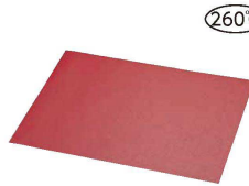
8 サーモ ベーキングマット 44545 (WSB-C-42)