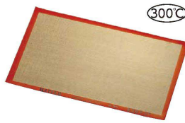
5 マトファ シリコンマット (WSL-76)

●シリコンとグラスファイバーで作られたオープンシートです。耐熱性と耐久性に優れており、幅広く御利用いただけます。