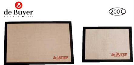
3 デバイヤー シルパット (WSL-53) 目