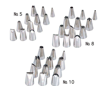
⑩ Ω 18-8 口金セット (WKT-38)