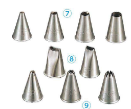
⑦ 18-8 口金(丸) (WKT-K3) ⑧ 18-8 口金(平波) (WKT-K5) ⑨ 18-8 口金(星) (WKT-K4)