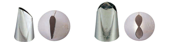
⑤ Ω 18-8 口金バラ (WKT-33) ⑥ Ω 18-8 口金ハッパ (WKT-34)