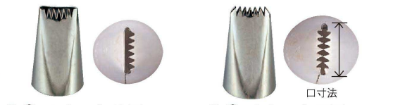
③ Ω 18-8 口金片目 (WKT-35) ④ Ω 18-8 口金両目 (WKT-36)