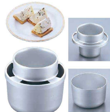
⑬ アルミ カサター (WKS-14)