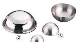
② Ω 18-0 ボンブ型 (WBV-06)