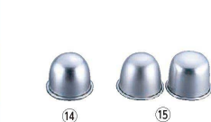
⑭ アルミ 高型ボンブ (WBV-05)