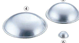
④ アルミ ボンブ浅型 (WBV-20)