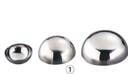
① Ω 18-8 ボンブ型 (WBV-03)