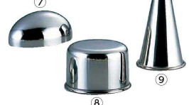
⑦ 18-8 レモン型ボンブ (WBV-13)