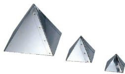
⑩ マトファ 18-10 ピラミッド ボンブ型 (WBV-02)