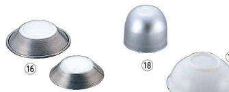
⑯ ブリキ 盃型カップ フチ巻型 (WKT-M0)