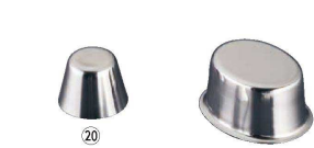
⑳ 18-8 アスピック (WAS-02)