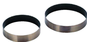
① Ω ストロングコート ケーキリング (板厚1mm・アルゴン溶接) (WKC-18)