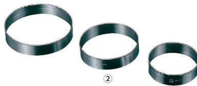
② Ω 18-0 ケーキリング (板厚1mm・アルゴン溶接) (WKC-14)

※特注サイズ承ります。 ●内面にフッ素樹脂加工を施してありますので、型くずれなく中の物を取り出せます。 ※外側はフッ素樹脂加工をする際に高熱で変色していますが材質上・使用上、共に何の問題もございません。