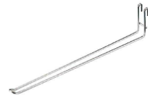
⑤ Ω 18-8 ネット用フック ロングタイプ (DHT-07) 1-1083-0501 ¥1,200

〈WSL-17〉 1-1083-0401 ¥21,000 ベース寸法:1,000×500 質量:2,100g フック寸法:全長:395/質量:160g×5 線材径:φ5mm ●フックが取り外しできますので、セルクルの大きさに応じて移動が可能です。 ※写真のセルクルは別売です。