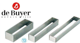
⑬ デバイヤー 18-10 レクタンギュラリング (WDB-A1)