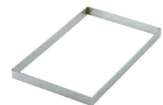
⑫ 18-8 角リング フレンチ (WSL-82) 内570×370