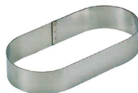
16 小判型 (WDB-64) 内