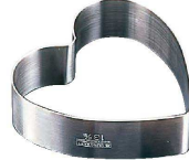
3 18-8 ハート型セルクル PP-632