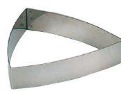
17 三角A型 (WDB-70) 内