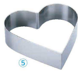
5 18-8 セルクルリング ハート 深型 (WSL-15)