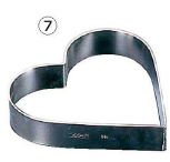
7 マトファ ハートリング (WHC-01)