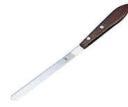
⑮ 木柄 シフォンケーキ用 スパテル (WSP-20) 1-1093-1501 L 刃渡り:175 全長:292 ¥1,500 1-1093-1502 S 刃渡り:145 全長:255 ¥1,250 ●シフォンケーキ型から焼き上がったケーキを取りはずすのに便利です。刃にそりがあり、型に添う使い易い設計です。