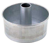
⑧ アルスター シフォンケーキ型 底取 (WSH-07)

フッ素樹脂加工されたシフォンケーキ型をお使いの場合、生地の状態(加える水分量や、粉の量、メレンゲの状態)や焼き時間・温度などにより冷却中にケーキの側面が型から離れてしまふ場合があります。これはこびりつきにくく、離型性の良いフッ素樹脂加工の特性です。ご了承のうえご使用をお願いします。