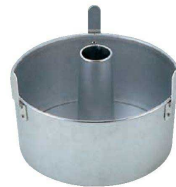
③ アルスター足付 シフォンケーキ型 底取 (WSH-08) 1-1093-0301 ¥4,150

20cm 内径(φ188)×H100 足の高さ:37 材質:スチール・アルミメッキ ●足が付いているので、さかさまにして冷ます時に安定性があります。