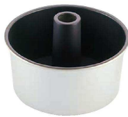
⑤ ストロングコート シフォンケーキ型 底取 (WSH-03)