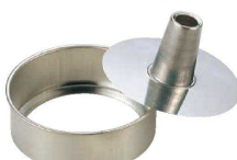
⑫ プリキ管付 デコレーション底取 15cm (WDK-06) 1-1093-1201 ¥1,800 内150×深さ62