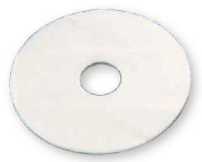
⑨ シフォンケーキ型用 敷紙 (WSK-36) 330