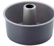
⑦ ブラック・フィギュア シフォンケーキ焼型 底取 (WSH-05)