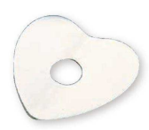
⑪ シフォンケーキ ハート型用 敷紙 20cm用 No.1314 (20枚入)