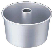
① TKG アルマイト シフォンケーキ型 底取 (WSH-29)