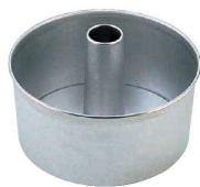
② アルスター シフォンケーキ型 底取 (WSH-04)