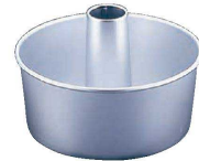
④ アルミ プレス シフォンケーキ型 底取 (WSH-01)

20cm 内径(φ188)×H100 足の高さ:37 材質:スチール・アルミメッキ ●足が付いているので、さかさまにして冷ます時に安定性があります。