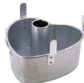
⑩ アルスター シフォンケーキ ハート型 底取 (WSH-09)