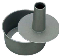
⑥ フッ素樹脂 ベイクウェア シフォンケーキ型 底取 (WSH-02)