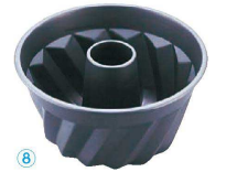
⑧ トップブラックセラコン クグロフ型 (WK-G-04)