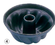
④ マトファ エッグパン クグロフ (WK-C-07)