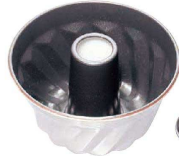
① アルミ ナノ・コーティング クグロフ型 (WK-C-04)

●内面に高機能フッ素樹脂加工の「ナノ・コーティング」を施してあるので、糖分が多いケーキでも焦げ付きにくく離型性も抜群です。 ※ナノコーティングの詳しい説明はP.1041に掲載しております。