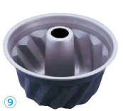
⑨ ブラック・フィギュア クグロフ型 (WK-G-03)