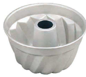
⑩ アルミ ネジレ菊 大 (WNZ-02) 1-1094-1001 ¥3,550