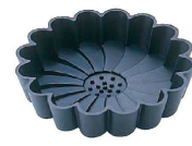
⑰ ブラックプリズム マルグリット型 No. 1250 (WML-05) 1-1094-1701 ¥3,100