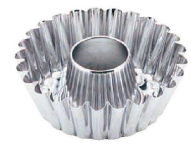
⑬ ST 蛇の目型 No.535 (WZY-02) 1-1094-1301 ¥2,100