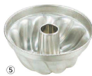
⑤ マトファ クグロフ (WK-C-05)