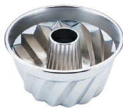
⑪ ギルア クグロフ型 (WK-G-05)