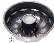
② アルミ ナノ・コーティング リングケーキ型 T106029