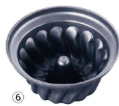
⑥ マトファ エッグガラス クグロフ 345642 洗