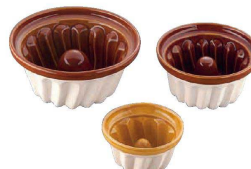
⑫ マトファ クグロフ陶器 (WK-C-06)