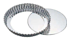
⑩ 18-0 タルト型 底取 (WTL-69) 目