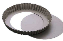
⑨ フッ素樹脂 ベイクウェア タルトケーキ型 底取 (WTL-68) 目