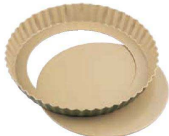
⑧ B-nat 底取式タルト型 (WTL-G4) 目