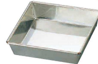
⑩ ㊦ マトファ 角マンケ (WMV-13)