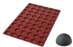
17 半球 54取 009020-4060 (WMA-34) 1-1122-1701 ¥27,500 600×400 出来上がり寸法:φ50×H25