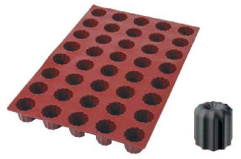
10 カヌレ 40取 004306-4060 (WMA-26) 1-1122-1001 ¥27,500 600×400 出来上がり寸法:φ55×H50