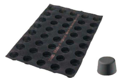
7 ラウンド 40取 010865-4060 (WMA-22) 1-1122-0701 ¥18,700 600×400 出来上がり寸法:φ46×H29