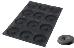
2 ベーグル 12取 011790-4060 (WMA-18) 1-1122-0201 ¥18,700 600×400 出来上がり寸法:φ110×H18