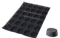
5 オーバル 30取 010868-4060 (WMA-21) 1-1122-0501 ¥18,700 600×400 出来上がり寸法:71×60×H28