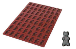
9 小グマ 64取 013652-4060 (WMA-25) 1-1122-0901 ¥27,500 600×400 出来上がり寸法:59×35×H18

耐熱温度:280℃ 耐冷温度:-45℃ 使用天板サイズ:フレンチサイズ600×400 (P.1041~1044参照) ※20のみサイズ400×300です。 材質:シリコン