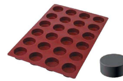
15 シリンダー 24取 001348-4060 (WMA-32) 1-1122-1501 ¥27,500 600×400 出来上がり寸法:φ70×H30