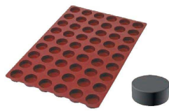
14 シリンダー 54取 002756-4060 (WMA-31) 1-1122-1401 ¥27,500 600×400 出来上がり寸法:φ50×H20