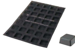
3 ミニスクエア 35取 012151-4060 (WMA-19) 1-1122-0301 ¥18,700 600×400 出来上がり寸法:56×56×H24