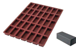
13 レクタングル 35取 008688-4060 (WMA-30) 1-1122-1301 ¥27,500 600×400 出来上がり寸法:100×40×H30