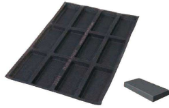
1 レクタングル 12取 011344-4060 (WMA-17) 1-1122-0101 ¥18,700 600×400 出来上がり寸法:180×80×H20

耐熱温度:260℃ 耐冷温度:-40℃ 使用天板サイズ:フレンチサイズ600×400 (P.1041~1044参照) 材質:グラスファイバー・シリコン加工