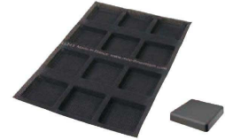
4 スクエア 12取 011343-4060 (WMA-20) 1-1122-0401 ¥18,700 600×400 出来上がり寸法:110×110×H20