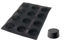
8 ラウンドパン 12取 010862-4060 (WMA-23) 1-1122-0801 ¥18,700 600×400 出来上がり寸法:φ92×H43