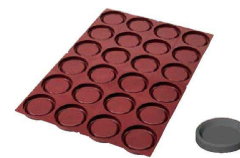
19 イージーパイ 24取 013732-4060 (WMA-36) 1-1122-1901 ¥27,500 600×400 出来上がり寸法:φ90×H15