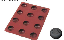
20 ペプルハニカム 12取 012714-4030 (WMA-27) 1-1122-2001 ¥15,000 400×300 出来上がり寸法:φ66×H32

シリコンマット デコレーター! 絞り袋・スハチユラ チョコプレート用品 ハケ・ゴムヘラ