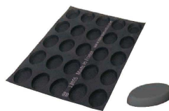
6 オーバル 25取 013855-4060 (WMA-24) 1-1122-0601 ¥18,700 600×400 出来上がり寸法:93×60×H25