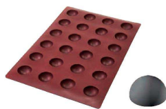
18 半球 24取 005230-4060 (WMA-35) 1-1122-1801 ¥27,500 600×400 出来上がり寸法:φ60×H30