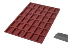
11 フィナンシェ 36取 000508-4060 (WMA-28) 1-1122-1101 ¥27,500 600×400 出来上がり寸法:87×49×H15