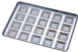
④ シリコン加工 カッター70型天板 20連 (WTV-79) 1-1126-0401 ¥31,500 545×395×H34 単品寸法 (A) (B) (H) 内 70×70×12