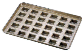
① シリコン加工 ホール型天板 (30ヶ取) (WTV-32) 1-1126-0101 ¥38,500 542×393×H53 単品寸法 (A) (B) (H) 内 52×42×30