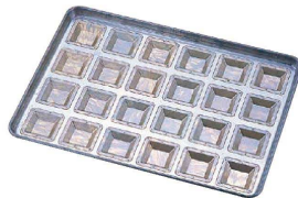
⑤ シリコン加工 カッター60型天板 24連 (WTV-80) 1-1126-0501 ¥33,000 545×395×H34 単品寸法 (A) (B) (H) 内 60×60×12