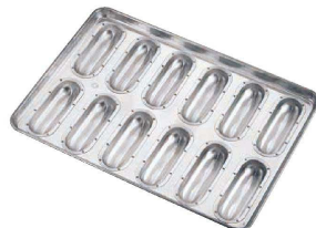
⑧ シリコン加工 シュトーレン天板 12連 (WTV-B4) 1-1126-0801 ¥34,500 545×395×H67 単品寸法 (A) (B) (H) 内 160×53×35