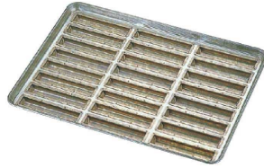
② シリコン加工 ラフト型天板 (24ヶ取) (WTV-70) 1-1126-0201 ¥36,500 545×395×H38 単品寸法 (A) (B) (H) 内 150×26×18