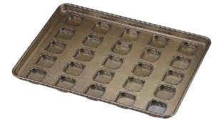
⑥ シリコン加工 サボン型天板 (25ヶ取) (WTV-13) 1-1126-0601 ¥33,500 545×395×H39 単品寸法 (A) (B) (H) 内 54×54×15