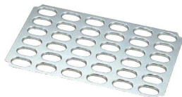
⑩ マトファ ダコワーズ 791749 (アルミ) (WDK-14) 1-1126-1001 ¥14,900 500×360×H8 (1ヶ当たり) 内60×40