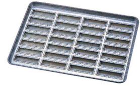
③ シリコン加工 ラフト型天板 M 28連 (WTV-84) 1-1126-0301 ¥36,500 545×395×H38 単品寸法 (A) (B) (H) 内 110×26×16