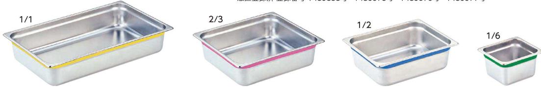
① DO-EN18-8 カラーラインガストロノームパン (AGS-25)