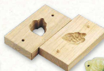
7 手彫物相型 (上生菓子用) みの亀 (WBT-17) 1-1178-0701 ¥23,000 約35×51×H30