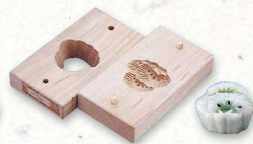
3 手彫物相型 (上生菓子用) 三階松 (WBT-13) 1-1178-0301 ¥22,000 約46×43×H29