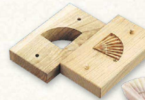
18 手彫物相型 (上生菓子用) 扇 (WBT-30) 1-1178-1801 ¥25,000 約56×42×H23