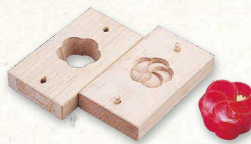
2 手彫物相型 (上生菓子用) なじ梅 (WBT-12) 1-1178-0201 ¥22,000 約41×40×H24