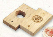
17 手彫物相型 (上生菓子用) ポタン (WBT-29) 1-1178-1701 ¥25,000 約45×38×H26