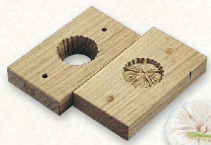
11 手彫物相型 (上生菓子用) 撫子 (WBT-22) 1-1178-1101 ¥25,000 約43×43×H25