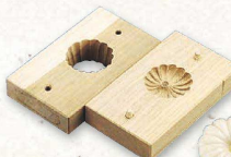
19 手彫物相型 (上生菓子用) スクイ菊 (WBT-31) 1-1178-1901 ¥23,000 約42×42×H28