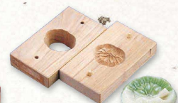
9 手彫物相型 (上生菓子用) 蓮葉 (WBT-20) 1-1178-0901 ¥22,000 約47×40×H29