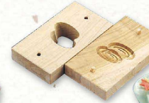
13 手彫物相型 (上生菓子用) 二重渦 (WBT-24) 1-1178-1301 ¥23,000 約50×37×H26