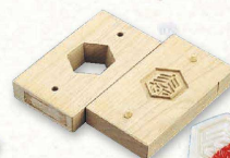
8 手彫物相型 (上生菓子用) 亀甲に寿 (WBT-18) 1-1178-0801 ¥25,000 約40×47×H24