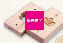
22 手彫物相型 (上生菓子用) 桜花 (WBT-34) 販売終了 ¥23,000 約47×43×H30