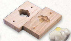
14 手彫物相型 (上生菓子用) アサメ (WBT-25) 1-1178-1401 ¥23,000 約46×40×H30