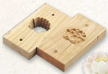
10 手彫物相型 (上生菓子用) 蓮花 (WBT-21) 1-1178-1001 ¥23,000 約45×40×H27