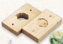
15 手彫物相型 (上生菓子用) イチョウ (WBT-26) 1-1178-1501 ¥22,000 約46×35×H24