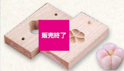
1 手彫物相型 (上生菓子用) 横福梅 (WBT-11) 販売終了 ¥22,000 約43×39×H28