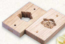
20 手彫物相型 (上生菓子用) スイセン (WBT-32) 1-1178-2001 ¥23,000 約46×43×H27