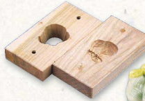
16 手彫物相型 (上生菓子用) 福寿草 (WBT-28) 1-1178-1601 ¥25,000 約38×44×H30