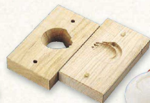
6 手彫物相型 (上生菓子用) 鶴 (WBT-16) 1-1178-0601 ¥22,000 約44×43×H29