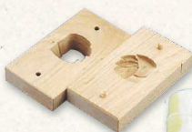
5 手彫物相型 (上生菓子用) 木竹 (WBT-15) 1-1178-0501 ¥22,000 約39×42×H30