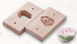
4 手彫物相型 (上生菓子用) 手折桜 (WBT-14) 1-1178-0401 ¥25,000 約48×37×H25