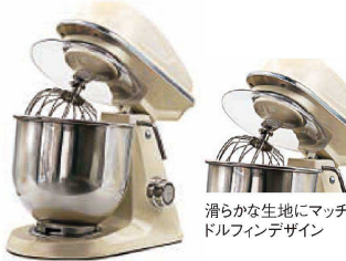
滑らかな生地にマッチしたドルフィンデザイン