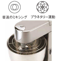
普通のミキシング プラネタリー運動