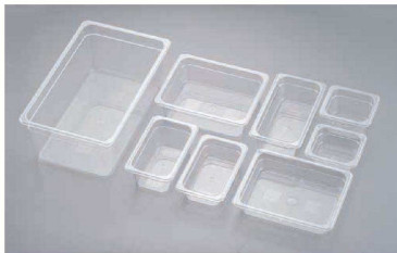
① トラストトライタン コールドフードパン クリアー 洗 (AHC-75)