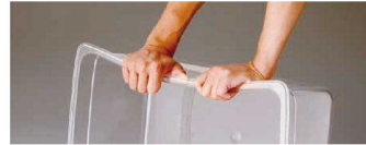
●割れにくく耐衝撃性に非常に優れ、食品保存や運搬などに最適です。

トライタンは人体に悪影響を受けるかもしれない化学物質ビスフェノールAを含みません。 妊婦、幼児からお年寄りまで安心してご使用いただける材質です。